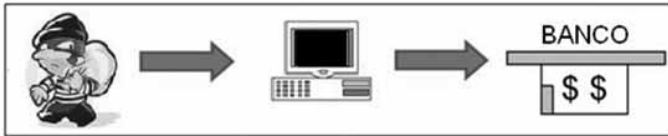
Figura 1.2 – Modalidade de crime em que o computador é o meio para a realização do delito.

legislação vigente 8 , mais precisamente o artigo 241-A do Estatuto da Criança e do Adolescente. Se o computador e a Internet não existissem, tal conduta seria impossível.